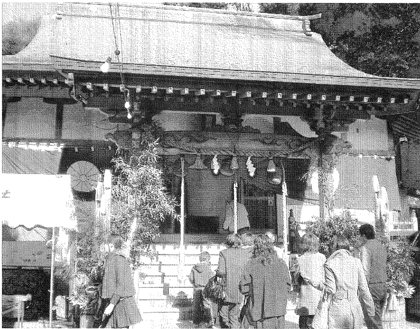
— 新年の阿蘇神社社頭 — 阿蘇神社 http://asojinja.jp