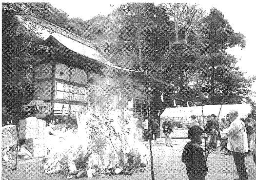
— 火焼神事 —

平成十五年生、平成三年生、 昭和五十四年生、昭和四十二年生、 昭和三十年生、昭和十八年生、 昭和六年生