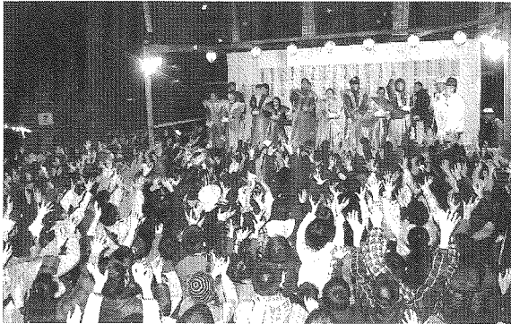
— 特設舞台から豆撒き —