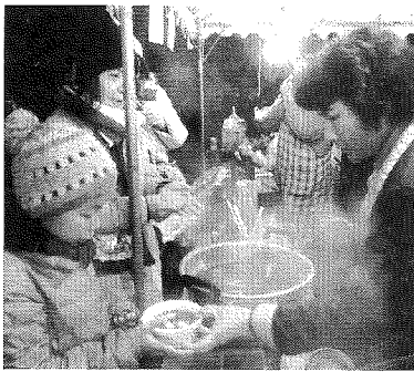
— 出店は盛況でした —