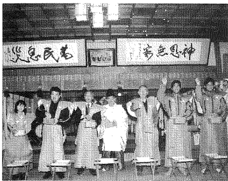
— 殿内での神事・まめ打ちの儀 —

節分行事の開催に当たり、準備から後片づけまで神社総代及び評議員、商工会青年部・女性部など多くの方々にご協力とご支援をいただきました。