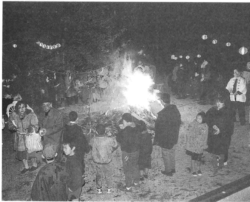
火焼神事 (ほやきしんじ)