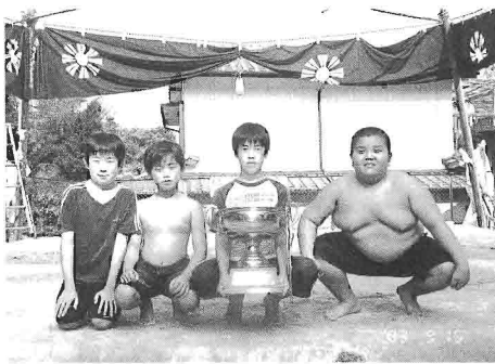
優勝した中里子供会チーム