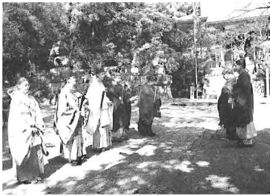
宮司以下祭員列立