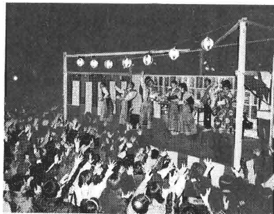
特設舞台からの豆撒き