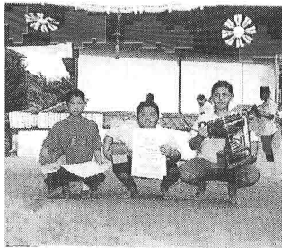
優勝の中里チーム